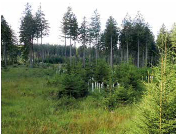
Bild 3: Auf wechselfeuchten bis nassen, sauren Standorten wie hier bildet sich natürlicherweise ein Moorbirkenbruch aus. Das Rotwild in der Eifel verhindert die Wiederbegründung des Bruchwaldes (nach Kyrill) und lenkt die Sukzession in Richtung Pfeifengras-Fichten-Fläche.

Doch wie kann sich ein „Urwald“ (genauso wie der „klimastabile“ Wirtschaftswald), wie von Politik und Gesellschaft gefordert, entwickeln, der sich nicht natürlich, also in seiner kompletten Artenvielfalt, verjüngt? Es gibt zwei Möglichkeiten, von der seit einigen Jahren eine im Mittelpunkt steht: Es gilt die offizielle Devise, die Schalenwildbestände mit jagdlichen Mitteln an den Lebensraum Wald anzupassen – wozu insbesondere die Förster im Staatswald beauftragt sind (Wiebe 2016). Das Bundesjagdgesetz wird derzeit zum ersten Mal seit 1977 gründlich novelliert, v.a. um „den Schutz des Waldes“ vor dem Rehwild zu verbessern (BMEL 2020). Die Erkenntnis, dass eine weitere klassische Wildbewirtschaftung und Hegejagd dringend beendet werden muss und nur die Anpassung der Wildbestände an den Wald erfolgreich sein wird, hat sich in der Politik durchgesetzt. Nach reiflichem Prozess. Denn die Probleme sind seit Jahrzehnten bekannt. Doch nach wie vor scheitern seit Jahren Forstämter und Eigenjagdbesitzer in etlichen Regionen an einer effektiven Anpassung der Reh- und Hirschbestände und damit dem Erreichen der Waldziele (Bild 3). Überall dort, wo die Jagd offensichtlich nicht funktioniert, muss die Jagdstrategie