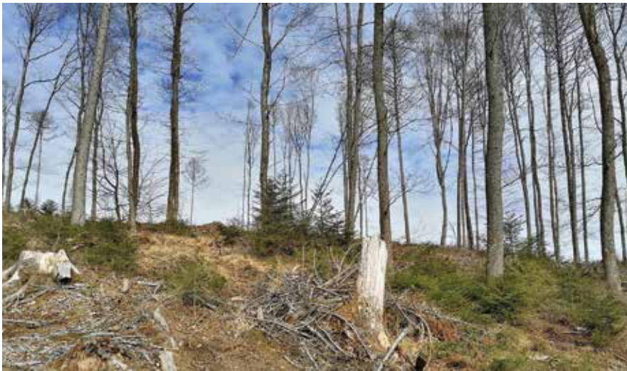
Bild 2: Schleichende Verfichtung eines Eichenwaldes auf Hainsimsen-Buchenwald-Standort im Bergischen Land

kannt, in denen Wälder wissenschaftlich untersucht wurden – alle mit dem Ergebnis: Die Wälder verjüngen sich nicht mehr natürlich. Vier Beispiele: