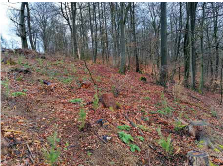
Bild 1: Küstentannen und Douglasien wurden auf einer Kalamitätsfläche im Sauerland gepflanzt. Ohne Puffer zum angrenzenden, naturnahen Hainsimsen-Buchenwald.

Im vergangenen Jahrzehnt wurden trotzdem immer mehr Beispiele be-