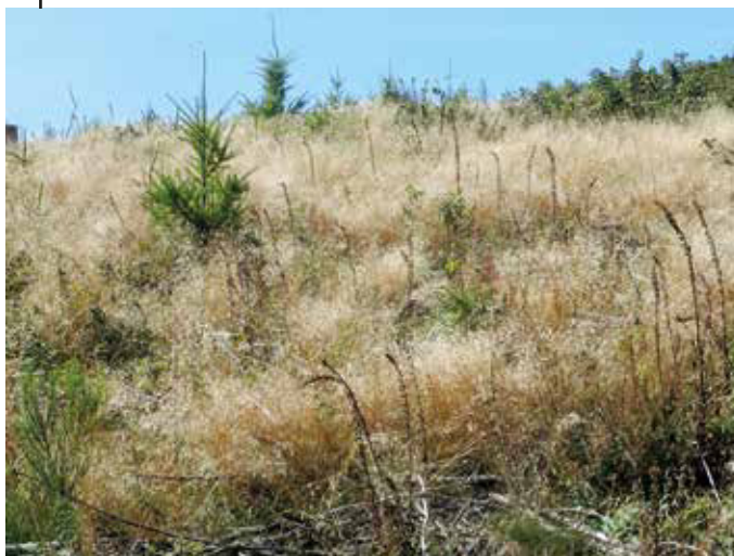
Bild 4: Ziel ist es, dass auf den ehemaligen Orkanflächen standortgerechte, stabile, strukturreiche und produktive Wälder entstehen“ (LWuH 2016) Dazu sollten etwa 2000 Laubbäume diverser Arten einer Generation in der Naturverjüngung dem Äser entwachsen, damit eine stabile Wiederbewaldung gesichert ist. Nach neun Jahren im April 2016 nimmt diese Fläche hingegen eine Entwicklung zu einer Fichten-Gras-„Steppe“. Hochsauerland 2016.

Das Ziel Nordrhein-Westfalens, auf 16.000 Hektar natürliche „Urwälder von morgen“ zu entwickeln und gleichzeitig die Wälder an den zu erwartenden Klimawandel anzupassen, ist illusorisch, solange die Wälder an einer kompletten Verjüngung gehindert werden. Bei fortbestehendem Verbissdruck durch Schalenwild werden ganze Generationen von Verjüngungsjahrgängen dem Wild geopfert. Solange die Schalenwildbestände nicht an den Lebensraum angepasst sind, werden die letzten Reste unserer natürlichen Wälder durch Entmischung schleichend in ihrer Artenzusammensetzung verändert und verarmt. Wenn man die