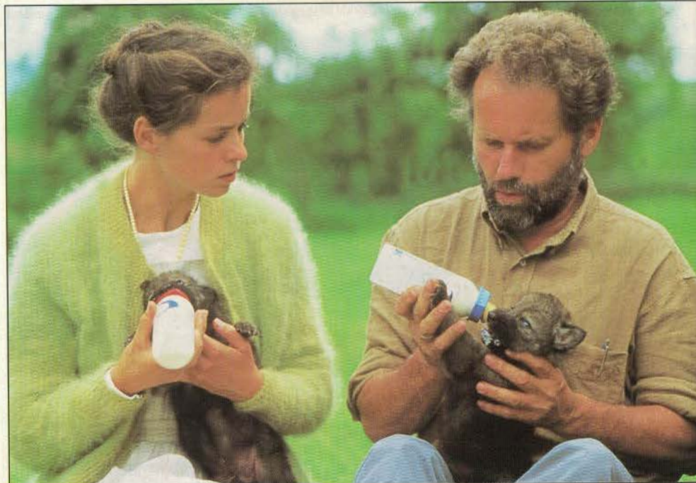
Bild 8: Nur wenn man Wolfswelpen sehr früh von ihrer Mutter wegnimmt und sie künstlich mit Milch füttert, werden sie zahm und zutraulich.

herung. Umgekehrt stürmten die Mehrzahl aller jung entnommenen Welpen zumindest auf ihre Betreuer, viele aber auch auf jeden in ihrer Nähe kommenden und sich normal verhaltenden Menschen und zeigten intensives Begrüßungs- Spiel- und Unterwerfungsverhalten. (Siehe Bild 9)