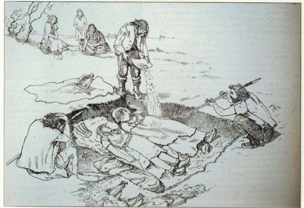
Bild 1: Der bislang älteste Fund eines Hundes stammt aus dem 14.000 Jahre alten „Doppelgrab von Oberkassel“.

Die Ergebnisse dieser Studie zeigen, dass Wolfswelpen nur dann an den Menschen sozial gebunden werden können, wenn sie in den ersten zwei Lebenswochen zum Menschen kommen. So wurden alle Welpen, die vor dem 14. Tag ihrer Mutter weggenommen wurden, zahm und stark bis sehr stark an den Menschen sozialisiert. Alle Welpen hingegen, die erst ab der dritten Lebenswoche zum Menschen kam, zeigten später Scheu vor dem Menschen und entwickelten keine soziale Bindung weder zu ihren Betreuern noch zu anderen Menschen. Hierbei zeigten die Welpen eine um so größere Fluchtneigung Menschen gegenüber, je später sie zu den Menschen gekommen waren. So verhielt sich z. B. ein erst im Alter von sechs Wochen seiner Mutter weggenommener Welpe, geradezu panisch bei jeder Annä-