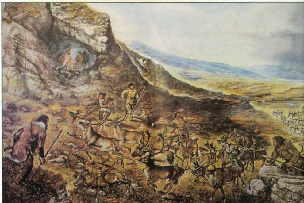
Bild 3: Riesige Rentierherden wanderten über die offene Tundra der ausgehenden Eiszeit. Aus dem Hinterhalt konnten geschickte Jäger auf einmal viel Beute machen. Als Waffe nutzten sie die Speerschleuder.