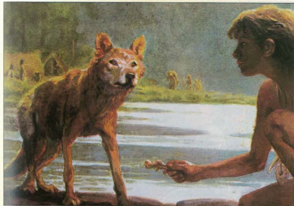
Bild 5: Die erste Domestikation eines Wildtieres war ein Meilenstein in der Kulturgeschichte des Menschen. Weitere Zähmungen anderer Arten folgten. Aus dem Jäger wurde der Hirte, aus dem Sammler der Bauer. Die wohl größte Kulturrevolution aller Zeiten nahm ihren Anfang. Unser funktionalistisches und männlich orientiertes Weltbild spricht diese epochale Tat natürlich dem Manne zu, dem einsichtig und auf ein zukünftiges Ziel hin bewußt handelnden Jäger.