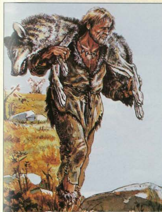
Bild 6: In Zeiten des Überflusses profitierten die „Pariawölfe“ der Eiszeit vom Jagdglück des Menschen; in Zeiten der Not wurden sie getötet.