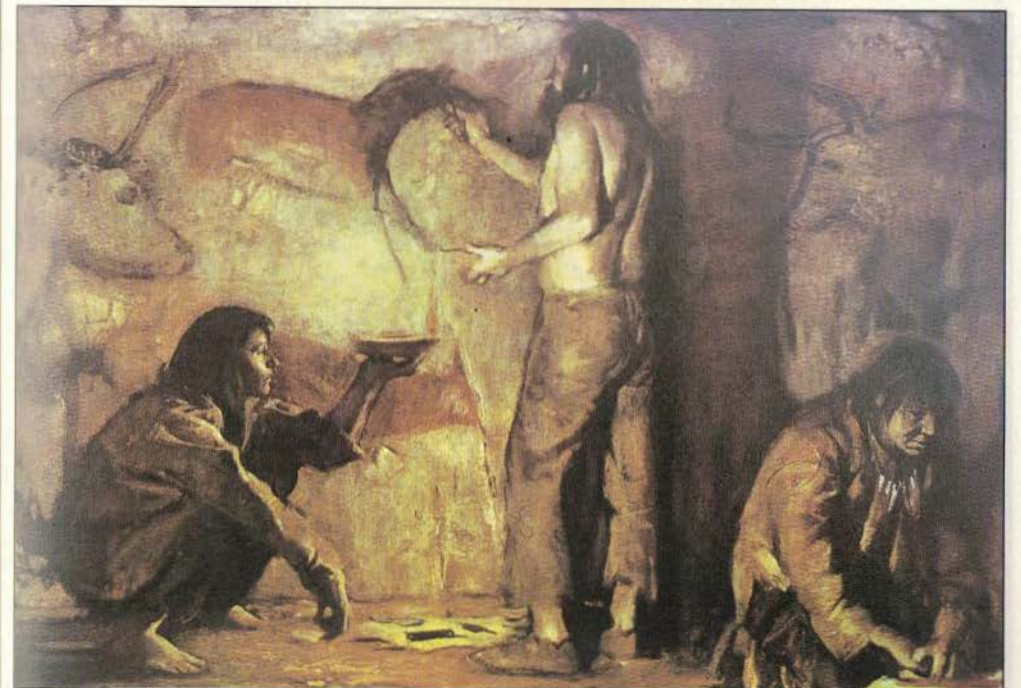
Bild 2: Am Ende der Eiszeit kam es vor ca. 15.000 Jahren in Süd- und Mitteleuropa zur ersten kulturellen Blütezeit des Menschen - dem Magdalénien.